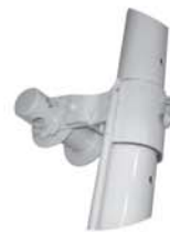
Poste de vôlei com regulagem (catraca)