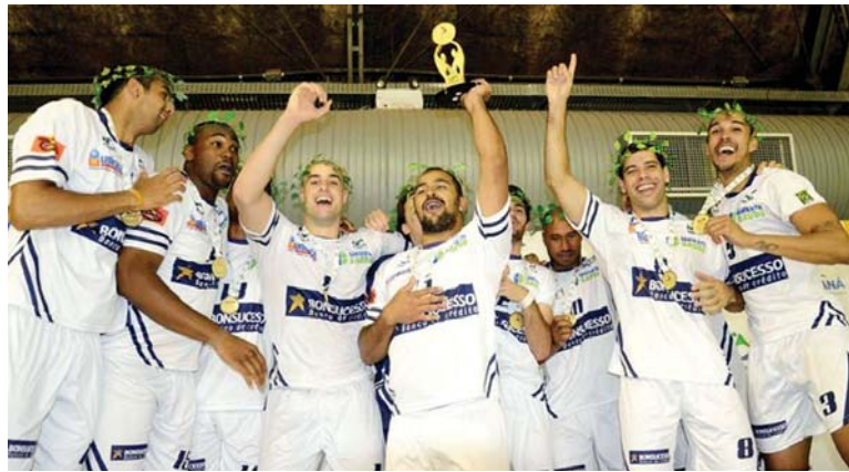
Vôlei Maringá - campeão volei masculino