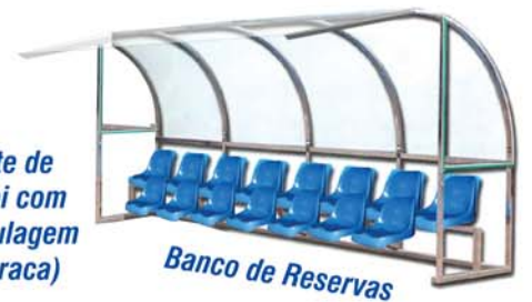
Banco de Reservas