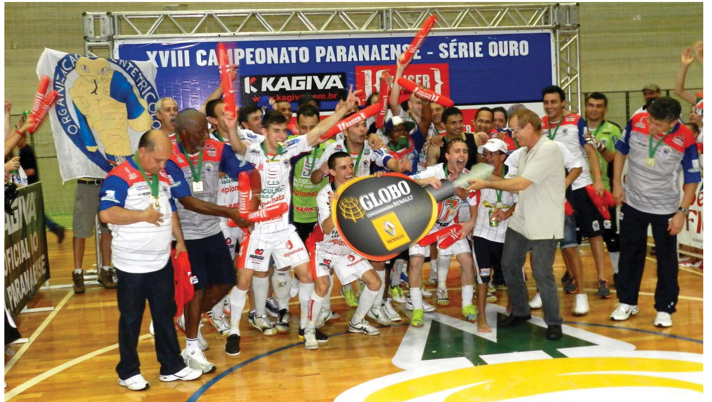
Equipe campeã: Diplomatta/Muffatão/Cascavel