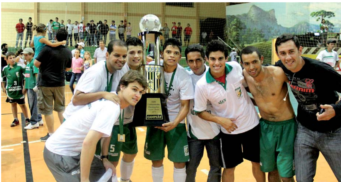
Terceiro empate seguido garante título da prata ao Ivaí