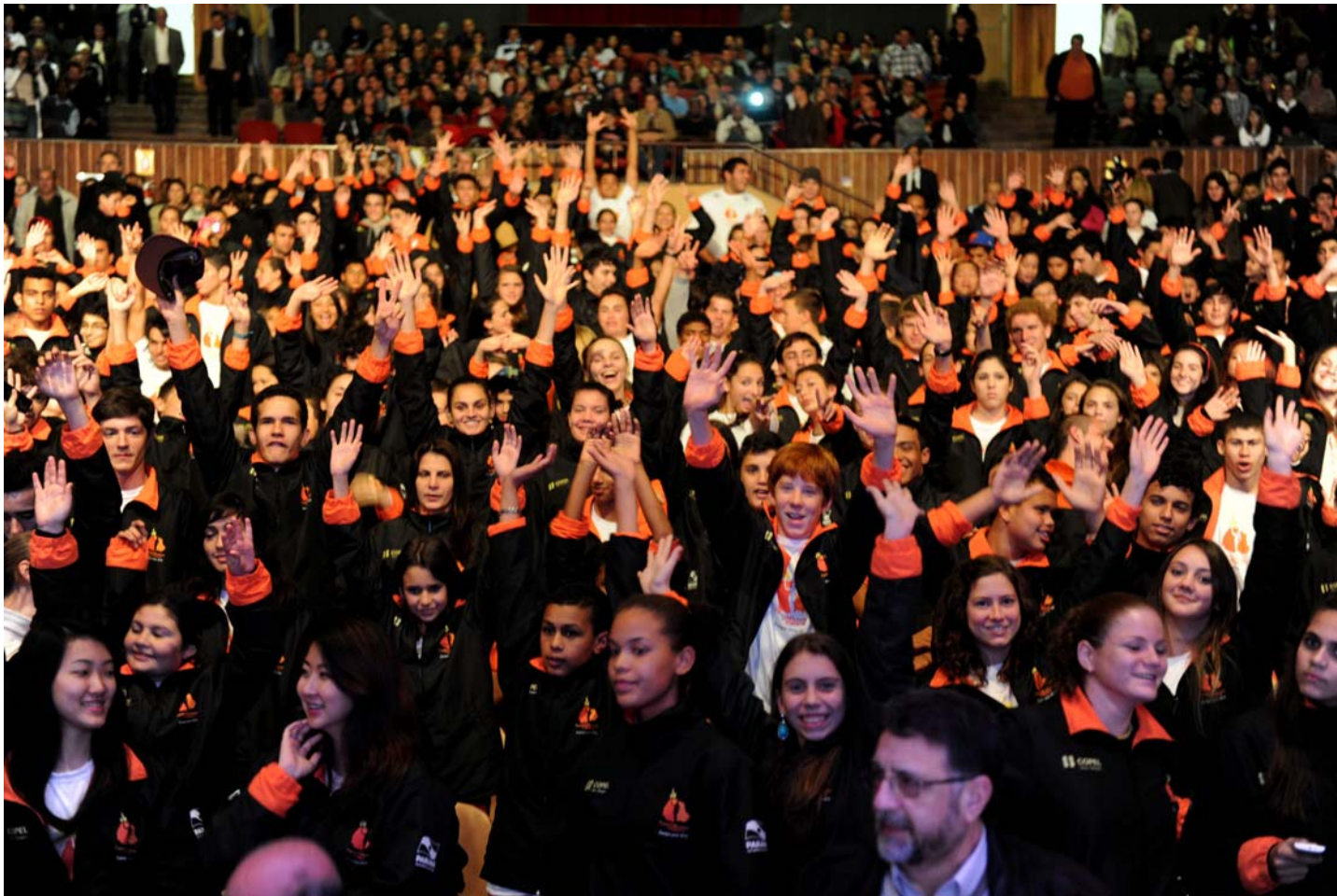
Atletas do TOP 2016

O Talento Olímpico do Paraná chega ao segundo ano de existência consolidado como o maior programa de incentivo ao esporte da história. Com aporte do Governo do Estado, Copel e Sanepar, o investimento no TOP saltou R$ 625 mil em 2011 para R$ 7,3 milhões em 2012. Em 2013, através de possíveis parcerias com novos patrocinadores, o objetivo do programa é ultrapassar a marca de R$ 10 milhões em investimentos.