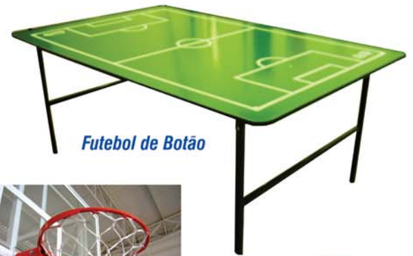
Futebol de Botão