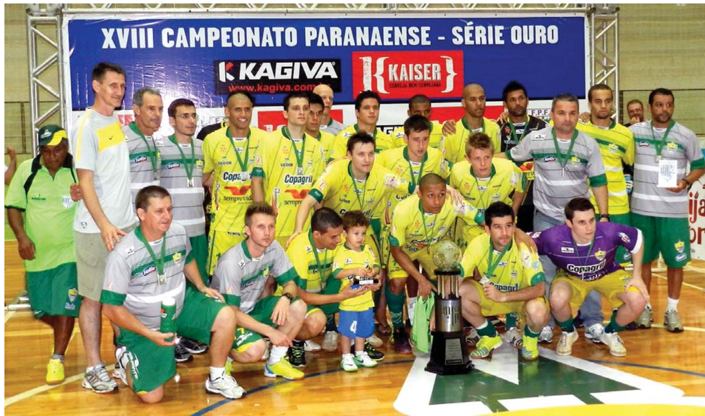
Equipe vice campeã: Copagri/DalPonte/MCR Futsal