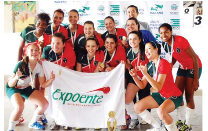
Vôlei Expoente - campeão

naipes feminino, que disputaram ao longo de três grandes prêmios o título da competição.