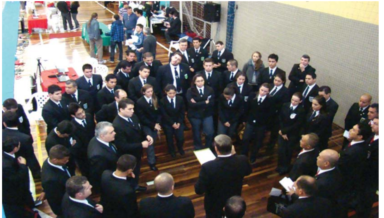
Aprovados passam a integrar o quadro de árbitros da PRrJ