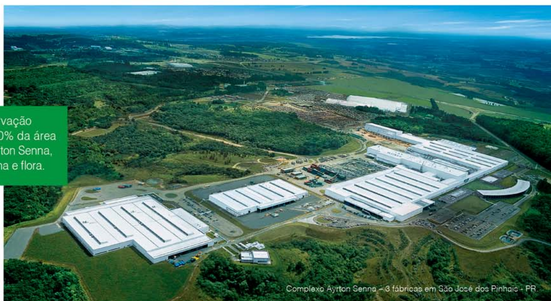
Complexo Ayrton Senna - 3 fábricas em São José dos Pinhais - PR

Ações de preservação que protegem 60% da área do Complexo Ayrton Senna, ocupada por fauna e flora.