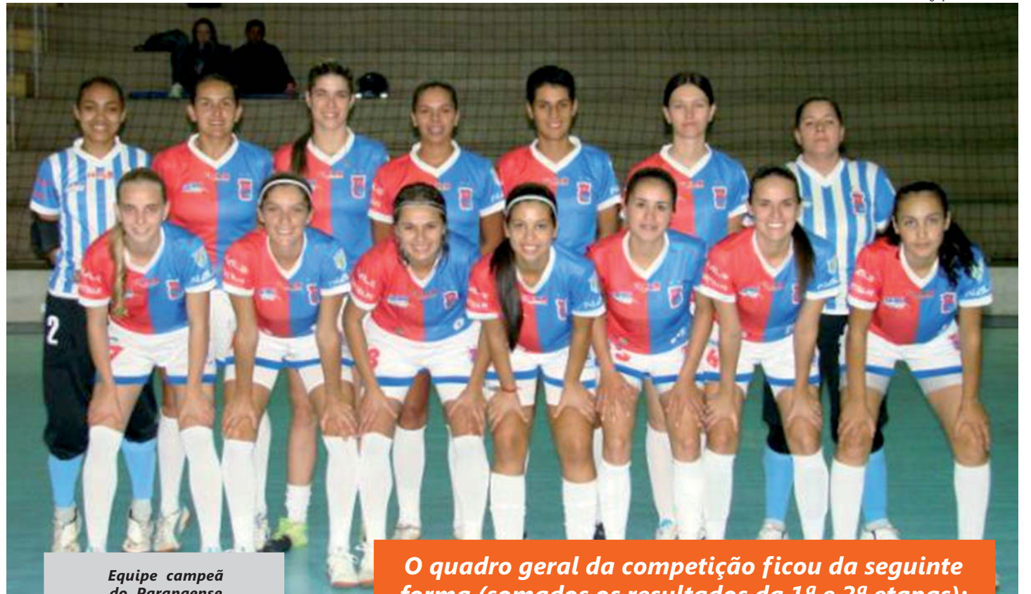
Equipe campeã do Paranaense

Os números falam por si, a equipe curitibana somou 26 pontos, somando as duas etapas, conquistados em 8 vitórias e 2 empates. Marcou 30 gols na somatória das duas etapas, com média de 3 gols por partida. Além disso, sofreu 12 gols em 10 partidas o que