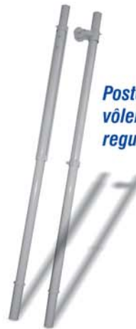
Poste de vôlei com regulagem