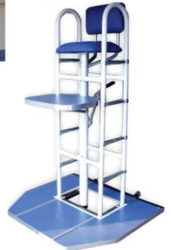
Cadeira p/ árbitro profissional