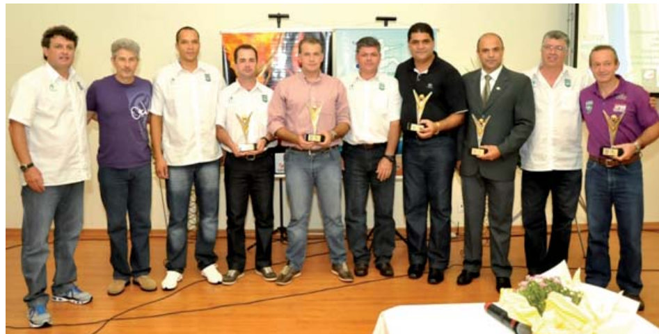
Premiados na categoria Amigos do Handebol Paranaense