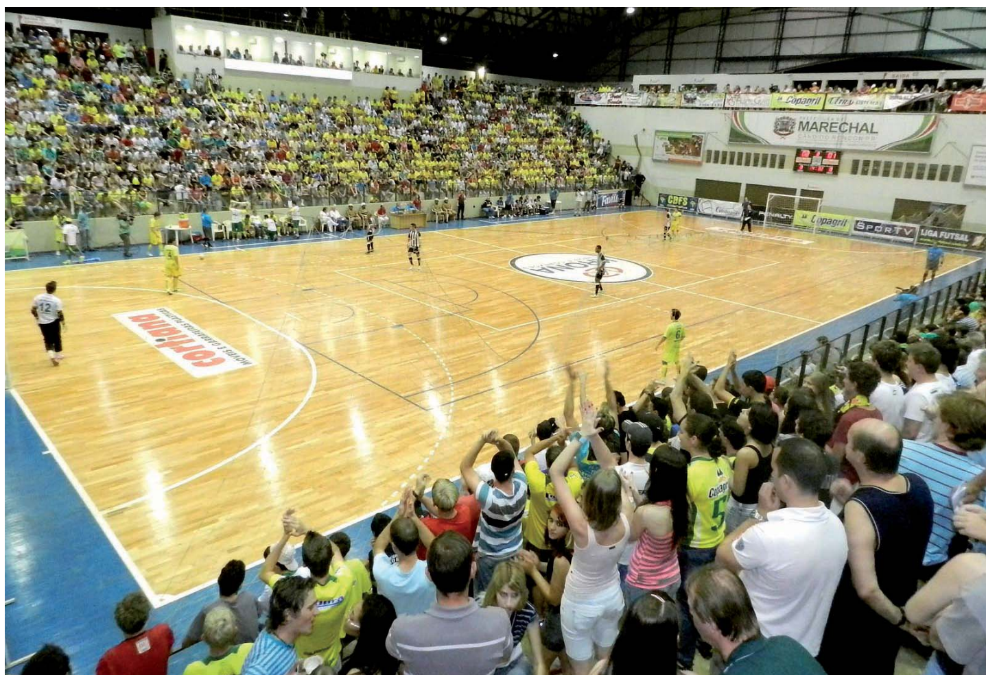
Ginásio com capacidade superior a 2500 pessoas, como com Ney Braga, em Marechal Rondon, têm que passar por vistoria mais rigorosa para serem liberados

- É importante que se forneça, nos recintos de grande aglomeração de pessoas, circulações de saída capazes de comportar, de forma segura, a passagem das pessoas dentro de um período de tempo aceitável, evitar o congestionamento das saídas e o estresse psicológico.